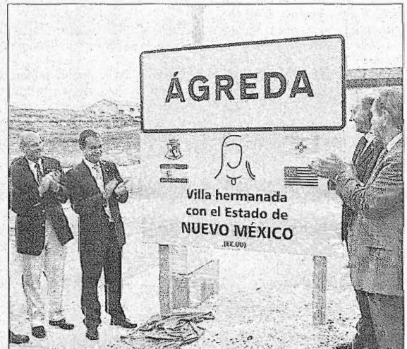
El cartel a la entrada de Ágreda que da fe del hermanamiento con Nuevo México.