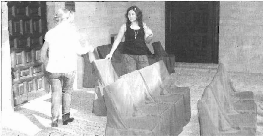
Aspecto que ofrecía ayer el patio del Palacio.

Todo está preparado para el evento. Ágreda espera recibir hoy la visita de más de un centenar de invitados al acto. En los últimos días los preparativos han causado expectación entre los vecinos. El Palacio de los Castejones, lugar en el que tendrá lugar el acto, ultimaba en la tarde de ayer la colocación del mobiliario así como la distribución de los invitados al acto. Las calles han recibido una limpieza especial y se han colocado jardineras y mobiliario urbano.